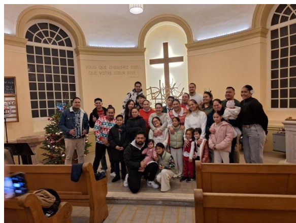
Veillée de Noël animée par nos frères et sœurs tahitiens à Chalon

INVITATION A TOUTES ET TOUS POUR UNE VISITE avec les jeunes de la catéchèse,