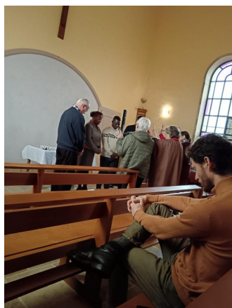
Bénédiction de ministères à l'animation des cultes Le 21 décembre à Sornay