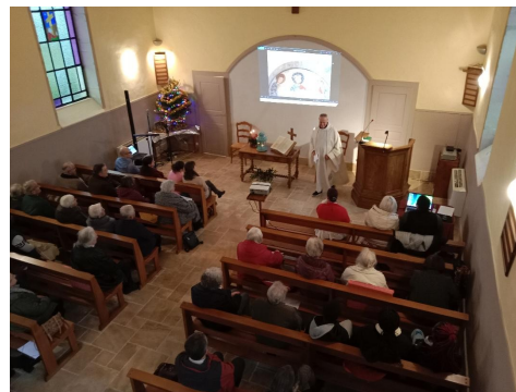
Célébration œcuménique de la Lumière de Bethléem le 7 décembre à Sornay