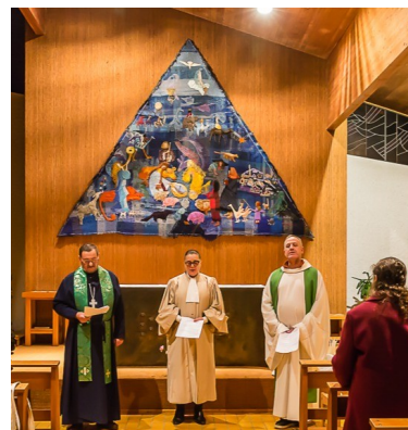
le 22 janvier 2026