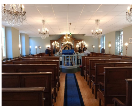
Accueil à la synagogue de Chalon le 1er mars 2026