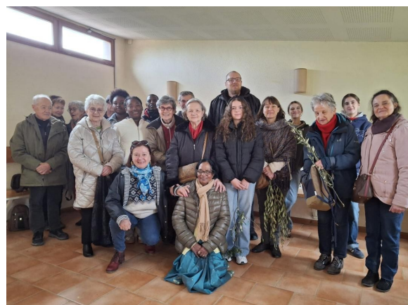
Sortie paroissiale pour la Fête des Rameaux à Taizé