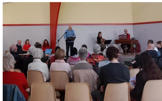
Exposition-spectacle le 8 février 2026 Tissage de rubans de vie à Sornay