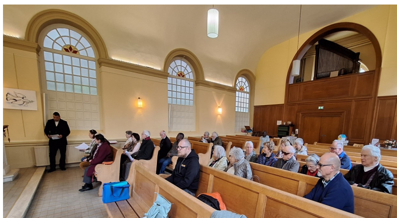
Assemblée générale de la paroisse Saône & Bresse