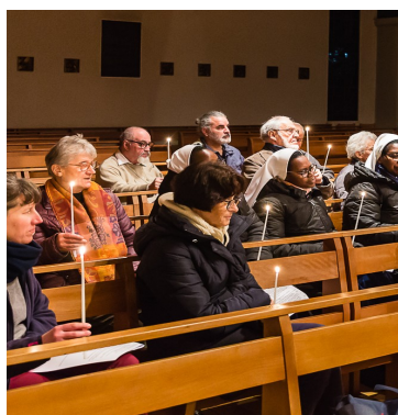
A l'Eglise de Sornay