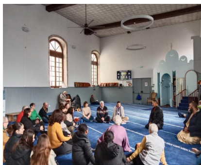
Accueil à la mosquée de Chalon le 1er février 2026