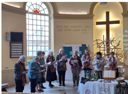
Célébration de la Journée mondiale de prière le 6 mars à Chalon