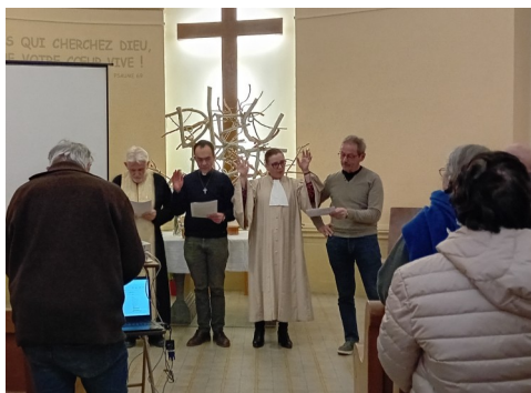
Célébration de l'Unité des chrétiens Au Temple de Chalon le 21 janvier 2026