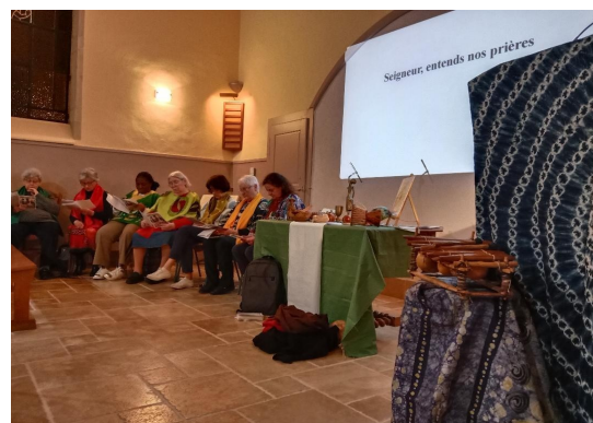
Célébration de la Journée mondiale de prière le 6 mars à Sornay